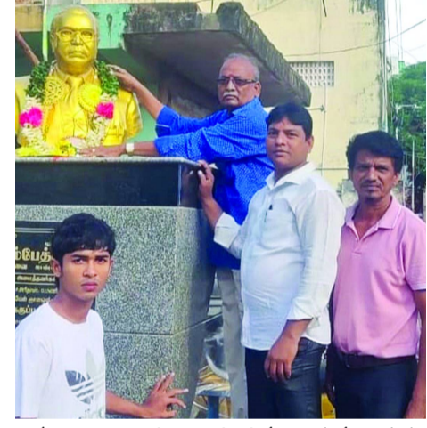
గొప్ప రాజ్యాంగాన్ని అందించిన ఆయన ఆశయ సాధనకు అందరూ కృషి చేయాలని కోరారు.